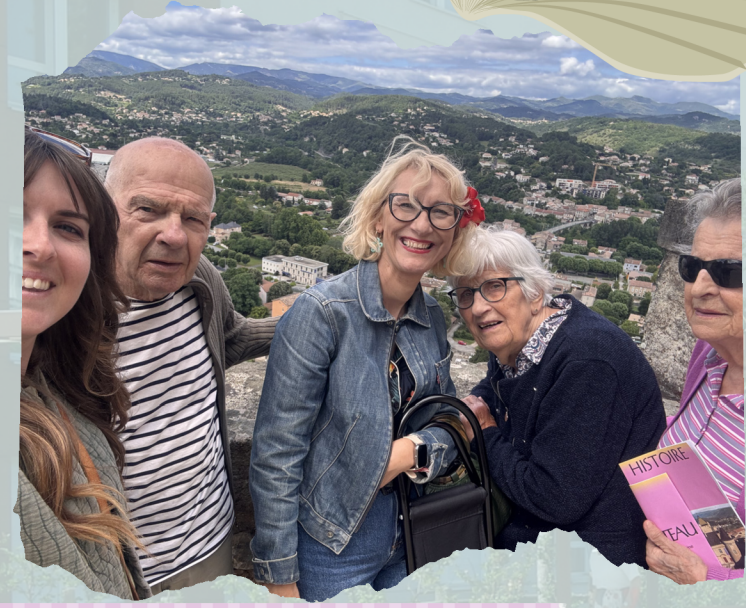
Visite du château d'Aubenas