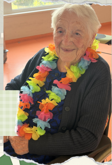
Goûter glaces au 1er étage