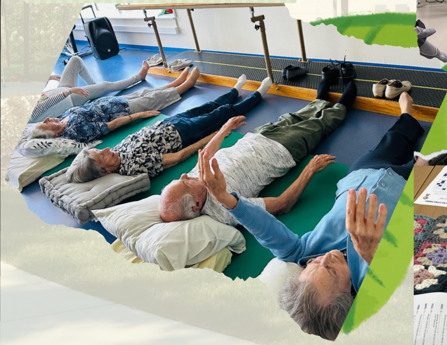
Cours de pilates

Sommaire Page 1 : photos Page 2 et 3 : programme des animations Page 4: photos