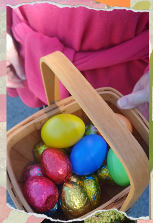
Chasse aux oeufs