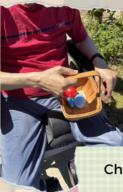
Chasse aux oeufs